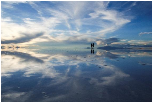
Tomás Saraceno endless big , 2006

Reflexionen umgeben ist. Es setzt sich aus fünf „Apachetas“ zusammen. Sie bestehen aus Salz, besitzen einen Durchmesser von zwei bis 24 Metern und sind bis zu zwölf Meter hoch. Einige von ihnen verfügen über Aussichtsplattformen, die über Treppen erreichbar sind. Das Projekt ist aus einem Dialog mit den lokalen Gemeinschaften entstanden und wird in ihrem Besitz von diesen als Ort für nachhaltigen Tourismus betrieben und verwaltet – mit dem Ziel, „Pachamama“ zu ehren und gerechte Kreisläufe von Wasser, Leben und Erinnerung zu stärken.