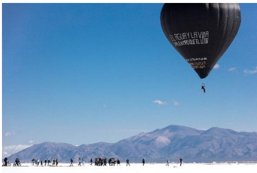
Tomás Saraceno Fly with Aerocene Pacha , 2020 Salinas Grandes und Laguna de Guayatayoc, Nordargentinien

Flashing Toilets wurde erstmals im Rahmen der Einzelausstellung „tomás saraceno“ in der Galerie neugerriemschneider in Berlin gezeigt. Es handelt sich um eine freistehende Toilette, deren interne Sanitärinstallation so umgestaltet wurde, dass das Wasser vom Händewaschen für die Spülung wiederverwendet werden kann. Anstatt nach dem Händewaschen abzufließen, wird jeder Liter Wasser zweimal genutzt. Anfängliche Vorschläge, die bestehende Sanitärinstallation der Galerie umzuleiten, konnten aufgrund von mietrechtlichen und behördlichen Auflagen nicht umgesetzt werden. Als skulpturale Präsenz wird das Werk zu einem „Proof of Concept“ für ein System, das bereits in allen Toiletten des Künstlerstudios im Einsatz ist und – wenn es im Galeriekontext realisiert würde – bis zu 14.000 Liter Wasser pro Jahr einsparen könnte. Das entspricht in etwa so viel wie der jährliche Verbrauch einer Haushaltstoilette in Deutschland. Saracenos Intervention stellt eine eigenständige Antwort dar, die bereits darauf ausgerichtet ist, eine neue Verbindung zu den Kreisläufen von Wasser und Leben herzustellen. Als funktionierender Prototyp eröffnet das Werk einen kleinen Ansatz, um den Kreislauf von Institutionen und Haushalten hin zu regenerativeren Abläufen zu verlagern.