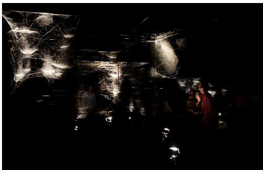
Tomás Saraceno. ON AIR Webs of At-tent(s)ion , 2018 Ausstellungsansicht Palais de Tokyo, Paris, 2018 Courtesy: der Künstler; Andersen's Contemporary, Kopenhagen; neugerriemschneider, Berlin, Pinksummer Contemporary Art, Genua; Ruth Benzacar, Buenos Aires; Tanya Bonakdar Gallery, New York. © Foto: Andrea Rossetti