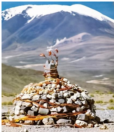
Apacheta, nördliche Anden

„The Sanctuary of Water“ verbindet sich mit der Kosmogonie der Anden und dem himmlischen Verständnis von Wasser, welchem zufolge die Zyklen des Lebens und des Kosmos miteinander verwoben sind. Für die Menschen der Anden ist Wasser ein Lebewesen, das zwischen Himmel und Erde wandelt, ein Verwandter, der mit seinem heiligen Kreislauf das Leben erhält. Wenn seine Wege im Gleichgewicht fließen, fließt auch unsere Existenz. Deswegen wird Wasser geehrt: In jedem Tropfen pulsiert eine gemeinsame Erinnerung – es zu schützen bedeutet, uns selbst und all jene zu schützen, die nach uns kommen werden.