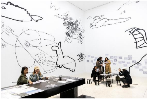
Tomás Saraceno. Complementaries Cloud Imagination, Aerocene Community Room , 2024 Ausstellungsansicht Red Brick Art Museum, Beijing, 2024