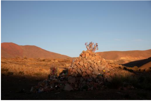
Tomás Saraceno Apacheta, Atacama Region, 2026