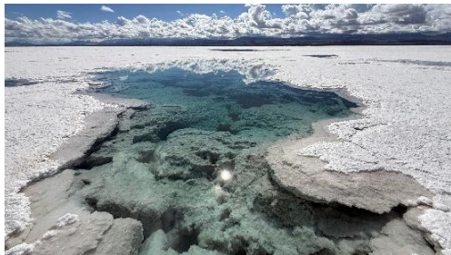
Tomás Saraceno Salinas Grandes, Nordargentinien, 2026

In den Höhen der nördlichen Anden, wo der Himmel die Erde berührt und die Zeit sich wie Salz ausdehnt, entsteht „The Sanctuary of Water“ als Geste der Dankbarkeit. Eine unvollendete Form, die erst dann vollständig ist, wenn das Wasser – Mutter, Spiegel, Erinnerung – seine verborgene Hälfte zurückgibt. Ein Gemeinschaftsprojekt für die Kunst des Guten Lebens im Miteinander.