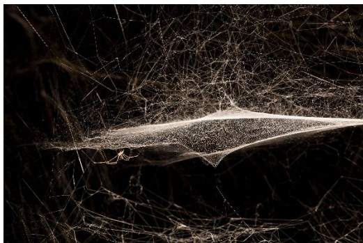
Tomás Saraceno. ON AIR Webs of At-tent(s)ion , 2018 Ausstellungsansicht Palais de Tokyo, Paris, 2018