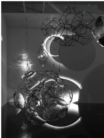
Tomás Saraceno. tomás saraceno i Ausstellungsansicht neugerriemschneider, 2025–2026