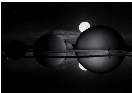
Tomás Saraceno The Sanctuary of Water , 2026 Konzipiert vom Künstler Tomás Saraceno in Zusammenarbeit mit den elf Indigenen Gemeinschaften des Red Atacama-Netzwerks, Salinas Grandes, Nordargentinien. Mit großzügiger Unterstützung des Haus der Kunst München, der Aerocene Foundation, Studio Tomás Saraceno und vielen weiteren. Courtesy: der Künstler, Red Atacama und die Aerocene Foundation, sowie die Galerien neugerriemschneider, Berlin, Tanya Bonakdar, Los Angeles, Pinksummer, Genua, Andersen's Contemporary, Kopenhagen und Ruth Benzacar, Buenos Aires.

„The Sanctuary of Water“ in den Salinas Grandes in Nordargentinien ist um ein kreisförmiges Becken angelegt, das den Himmel widerspiegelt und von Lichtkreisen und