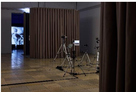
Steina: Playback Machine Vision , 1975–78 Ausstellungsansicht | Exhibition view Haus der Kunst München, 2026 Collection of the National Gallery of Iceland, LÍ - 9143 | Sammlung der Isländischen Nationalgalerie, LÍ - 9143