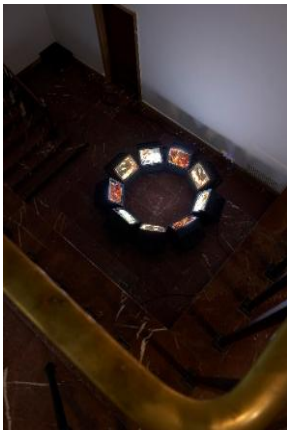
Steina: Playback Pyroglyphs , 1995 Ausstellungsansicht | Exhibition view Haus der Kunst München, 2026