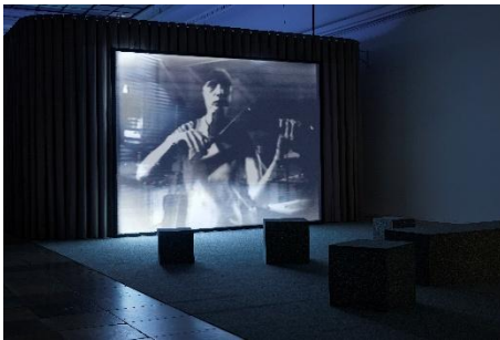
Steina: Playback Violin Power , 1970–78 Ausstellungsansicht | Exhibition view Haus der Kunst München, 2026