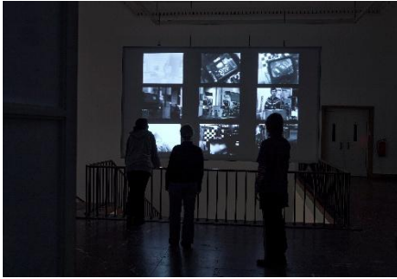
Steina: Playback Steina und | and Luca Ceccarelli Outer Cosmos , 2026 Ausstellungsansicht | Exhibition view Haus der Kunst München, 2026