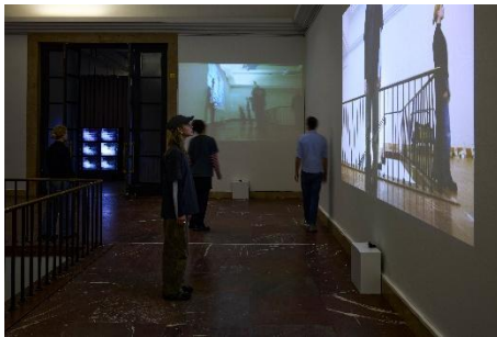
Steina: Playback Bent Scans , 2001 Ausstellungsansicht | Exhibition view Haus der Kunst München, 2026

Alle Bilder können auch mit folgendem Credit genutzt werden | All images may also be used with the following credit: