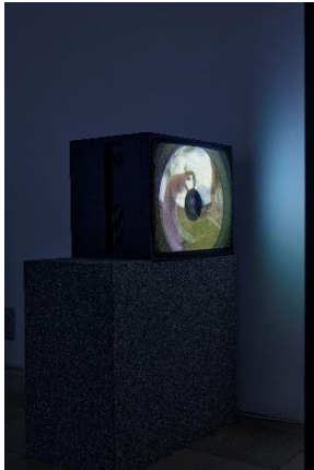
Steina: Playback Somersault , 1982 Ausstellungsansicht | Exhibition view Haus der Kunst München, 2026